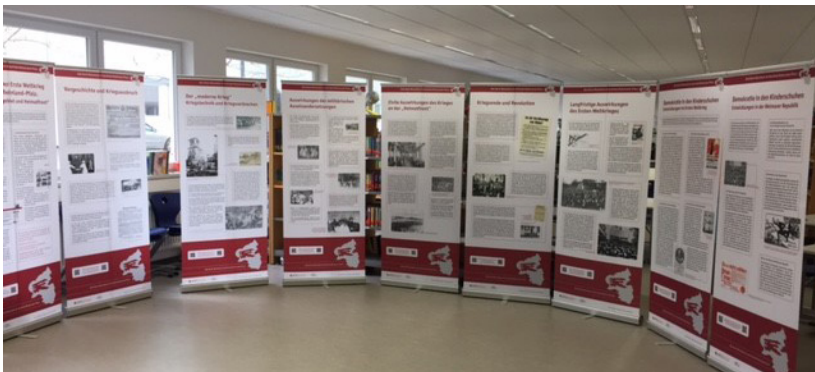
Vom 9. März bis zum 13. April 2017 war die Ausstellung im Gymnasium Mainz-Oberstadt zu sehen.

stabilen und transportablen Roll-ups zur Verfügung gestellt, die von 2016 an von Schulen und anderen Bildungseinrichtungen im Land ausgeliehen werden kann. 2017 war die Ausstellung an sieben Schulen (zweimal in Mainz, in Nieder-Olm, Landau, Boppard, Speyer und Wissen) zu sehen.