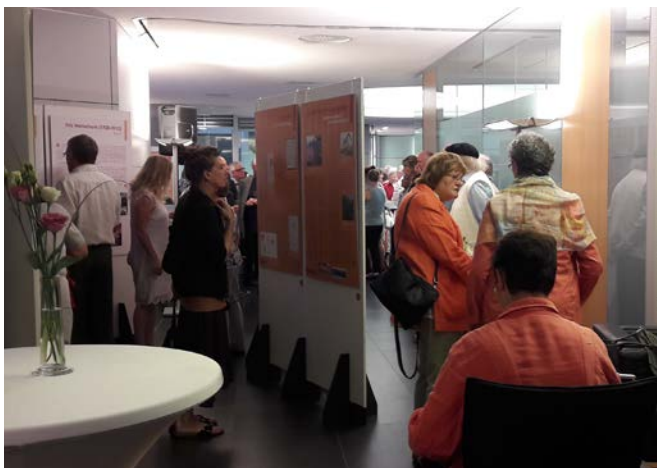
Eindrücke der gut besuchten Vernissage in der Gonsenheimer VR-Bank Filiale am 18.08.2017

die Aufarbeitung des nationalsozialistischen Terrors und des Völkermordes an den Juden in ihrer ganzen Dimension möglich. Dieser Prozess vollzieht sich noch immer – und noch immer sind einzelne Kapitel dieser Geschichte nicht hinreichend erforscht.